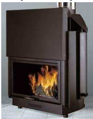
Acquatondo 29 piano